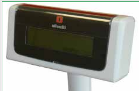
Display cliente grafico remotizzato