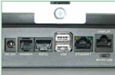
Ampia disponibilità di connessioni